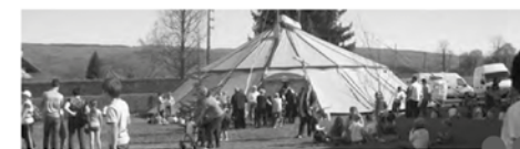
« J'ai tout oublié », « C'était extraordinaire », « J'étais jamais allé sous un chapiteau, j'avais hâte... »