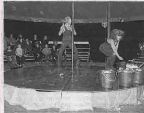
Le spectacle de cirque contemporain, présenté par la compagnie Pêcheurs de rêves, a plongé le public dans un conte étrange.