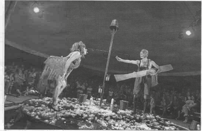
Dans un langage gestuel et clownesque, des personnages sans limites, qui vous embarqueront le plus loin possible PH. DA

Pour l'occasion, la compagnie « Les Pêcheurs de Rê-