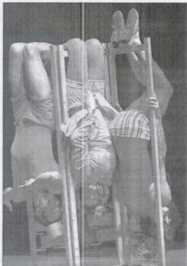
Les Pêcheurs de rêves ont donné leur spectacle « Nos désirs font désordre » à l'Espace Grün.