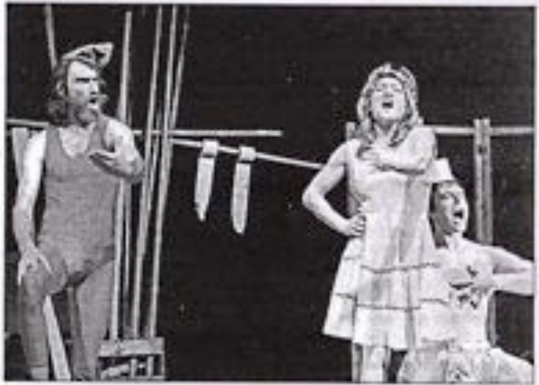
Des Pêcheurs de rêves aux désirs en désordre.

Le spectacle se déroule dans trois maisons en bord de piste, un décor de bambous et une