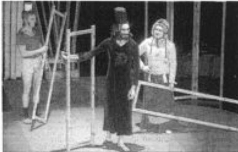
Trois Pêcheurs de Rêves qui jonglent, jouent des airs d'accordéons, dansent, font des acrobaties et des forces.

Dans la salle, le jeune public s'enthousiasme lorsque surgissent trois personnages extraordinaires. Il y a une femme, aux joues rouges et rebondies, à la mine gourmande, coiffée d'un bonnet de fourrure, avec un accordéon. Elle semble sortir d'un conte russe, à l'instar de ses compagnons. L'un, malgré et bien sûr comme un félin, porte une longue robe orientale et une haute toque indéfinissable sur la tête. Le troisième en singe de corps rose, ne se sépare jamais de ses accessoires les plus précieux : ses rouleaux de pa-