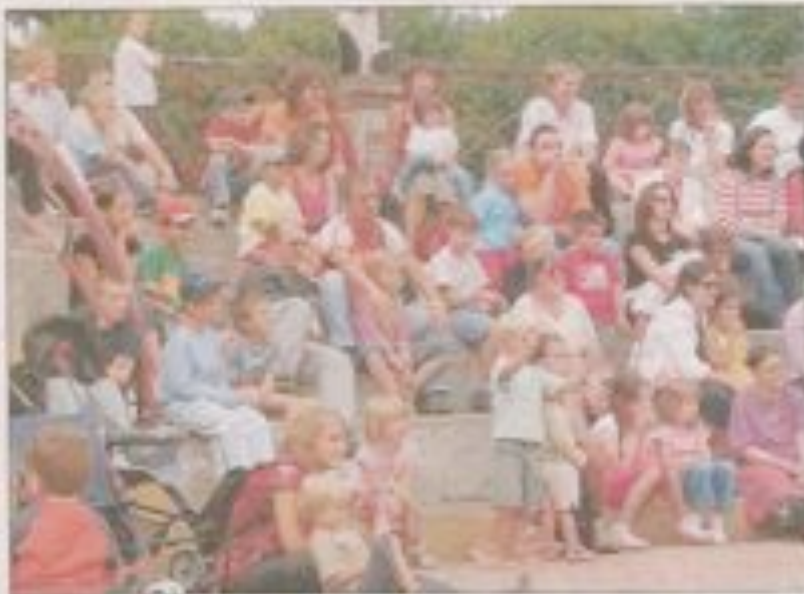
Les photographes de cinema ont offert au public une documentation précieuse de l'histoire dans une dimension de langage visuelle.

La final s'efface avec parcimonie des habituels classiques dans une atmosphère de musique lointaine, mais la conclusion