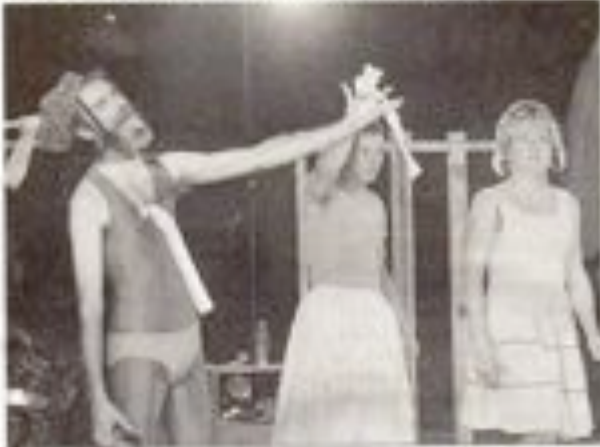
Les trois nouveaux poissons d'été se sont mis en quatre pour séduire le public.

Mardi soir, dans le parc de la mairie de Lisieux, le public est resté, les enfants sont assis devant à même le sol.