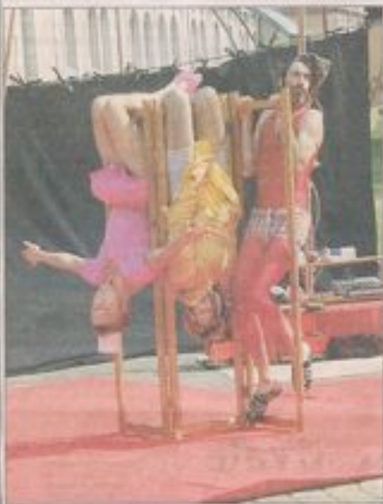
Une bien drôle de position !