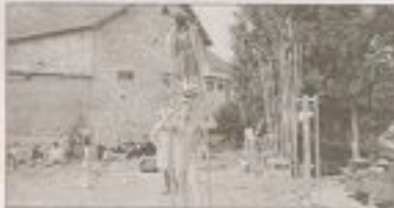
Les Pêcheurs de Rives évoluent dans un univers barlesque et poétique

Les résultats de la tombola Les numéros gagnants de la tombola : 582 : un mini-four ;