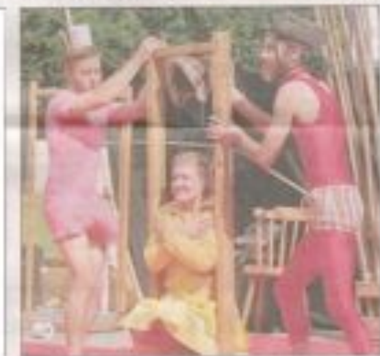
Le développement d'expertise pour les métiers professionnels techniques.

Un drôle de trio de downs ! Avec chacun leur forte personnalité, ces personnages quasi muets multiplient les gaffes et les mal-