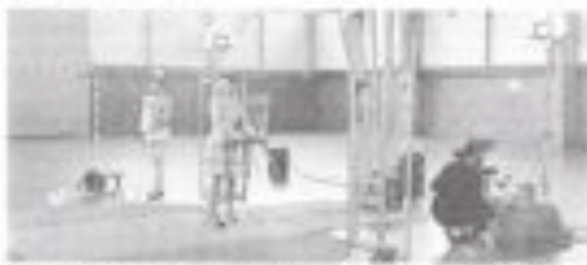
Les expériences de résonance, dans lesquelles les jets sont excités à partir

La ricerca del "giusto" è diventato il tema centrale del pensiero. L'idea di "giusto" è diventata un'idea di "giusto" per tutti, non solo per i filosofi, ma per tutti. La ricerca del "giusto" è diventata un'idea di "giusto" per tutti, non solo per i filosofi, ma per tutti.