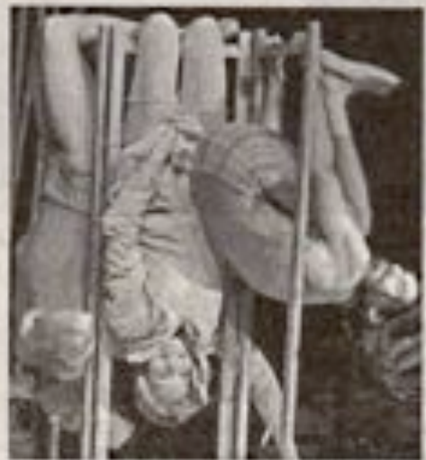
Trois clowns qui se mettront en quatre pour séduire leur public.

Une princesse boulimique, un grand famélique et un flamand rose égocentrique se partageront la piste pour faire un cirque très décalé : ces trois clowns quasi muets multiplieront les gaffes et les mal-adresses. Un univers explosif et burlesque qui les amène souvent au hors-piste. Entrée : 3€, Tél. 02 51 39 68 58