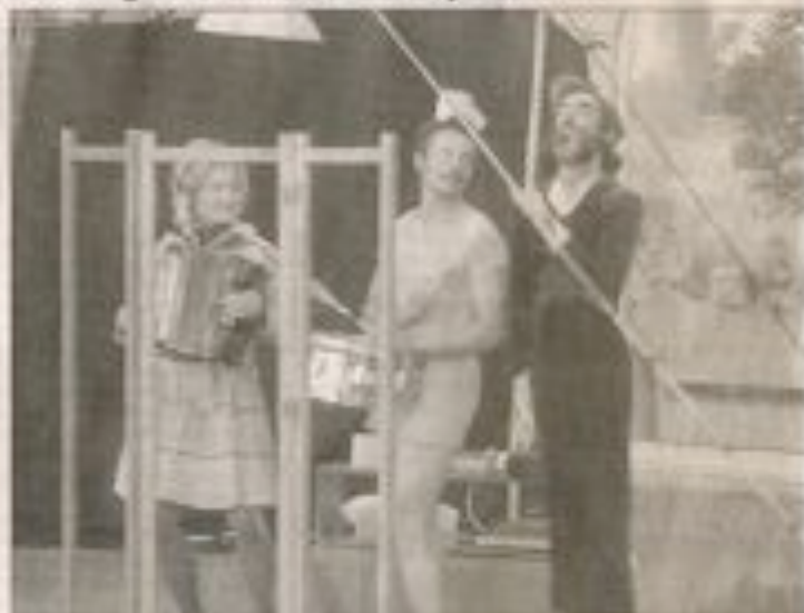
Le trio déjanté des pêcheurs de rive.

Derrière un voile de papier, ces trois artistes complètement déjantés ont tout fait pour offrir un spectacle très décalé, un mélange de charade, de mime, de comédie, de mime et de spectacle, un patchwork de créativité.