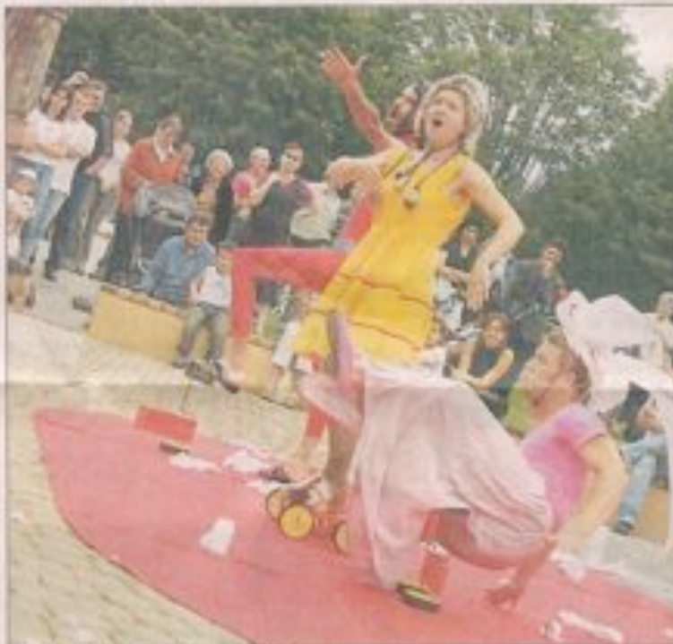
Un spectacle plein d'autodérision.